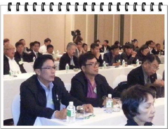
กรรมการเข้าร่วมสัมมนาไตรภาคีวิชาการ ประจำปี 2556 ณ โรงแรมฮอติเคย์ อินน์ เชียงใหม่

การสัมมนามีวัตถุประสงค์เพื่อให้ผู้บริหารสหกรณ์ต่าง ๆ ได้รับทราบเกี่ยวกับภาวะเศรษฐกิจและแนวโน้มอัตราดอกเบี้ยปี 2557 เพื่อได้รับทราบและเข้าใจเกี่ยวกับยุทธศาสตร์วาระแห่งชาติด้านการสหกรณ์ และ เพื่อได้มีโอกาสเพิ่มพูนความรู้และแลกเปลี่ยนประสบการณ์